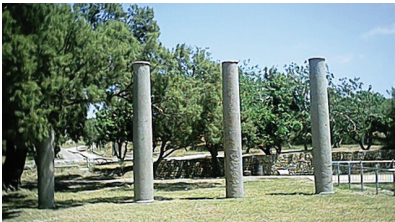
עמודים רומיים בפארק הלאומי באשקלון

אשקלון היא עיר במישור החוף הדרומי. זוהי אחת הערים העתיקות בעולם, ונזכרת בתנ"ך בתור אחת מחמשת ערי הפלישתים. בתקופת בית שני היא נבנתה מחדש ושימשה כעיר נמל ומרכז תרבותי חשוב, בה התגוררו יהודים ונוכרים. בימי הביניים השתלטו עליה הצלבנים, אולם מאוחר יותר כבשו אותה הממלוכים והחריבו אותה. ליד חורבותיה קמה העיירה הערבית מג'דל, שלאחר בריחת תושביה במלחמת העצמאות הוחלט ליישב אותה ביהודים. עולים רבים התיישבו במקום, העיר הלכה וגדלה, ובשנת 1955 נקראה בשם אשקלון. כיום גרים באשקלון כ-144 אלף תושבים, והיא נחשבת לאתר תיירות לאומי.