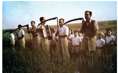
קציר תבואה בחג העומר, זכר למנחת העומר

התורה מצווה לקצור ולהביא למקדש את הקציר הראשון של השנה, לשם הקרבת מנחת העומר. הזמן שנקבע לכך הוא "ממחרת השבת". בתקופת בית שני הייתה מחלוקת גדולה סביב השאלה מה הכוונה במועד זה. הפרושים, עליהם נמנו חכמי ישראל, קבעו שהכוונה היא למחרת יום טוב הראשון של פסח. לעומת זאת הבייתוסים טענו שהכוונה היא למחרת יום השבת שאחרי הקרבת הפסח, ואין לה תאריך קבוע. כדי לשלול את עמדתם של הבייתוסים, נהגו החכמים לערוך את טקס קצירת העומר בחגיגות ובמעמד עם רב, ובכך הראו שהמצווה אכן מתקיימת דווקא במוצאי חג הפסח ולא בזמן אחר.