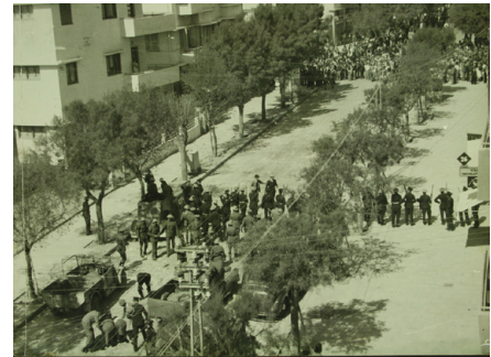
הפגנה בתל אביב נגד מדיניות הספר הלבן, מאי 1939

הספר הלבן, שכונה גם "ספר המעל", היה קובץ תקנות שפורסם על ידי ממשלת בריטניה, שעניינם היה הגבלה משמעותית של מספר היהודים שיוכלו לעלות לארץ ישראל, וגם זו תותנה בהסכמת הערבים, וכן הגבלה על היהודים לרכוש קרקעות בארץ ישראל. התגובות בארץ לתקנות הללו היו קשות מאוד, וגרמו לצמצום משמעותי של העלייה לארץ ושל רכישת הקרקעות. דוד בן גוריון קרא לספר הזה "ספר המעל" וראה בו נסיגה של הבריטים מהצהרת בלפור. היישוב היהודי החל להתארגן ולפעול נגד התקנות ונגד השלטון הבריטי, והמחתרות שפעלו בארץ פעלו בדרכים מחתרטיות וצבאיות שונות כדי לגרום לבריטים לעזוב את הארץ, ולא לקיים את מדיניות "הספר הלבן".