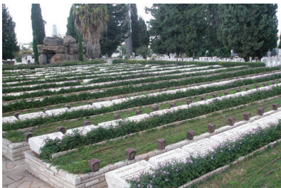
חלקה צבאית בבית הקברות נחלת יצחק, ומעבר לה אנדרטה לנספים בטרבלינקה

בית העלמין נחלת יצחק נפתח בשנת 1932, לאחר שהתמלא בית העלמין הישן בתל אביב ברחוב טרומפלדור. כיום הוא מכיל כ-30 אלף קברים, ביניהם קבריהם של אישים ידועים רבים ורבנים חשובים. בבית העלמין יש ארבע חלקות צבאיות בהן קבורים חללי מלחמת העצמאות, וחלקה ללוחמי המחתרות, ביניהם מפקד הלח"י יאיר שטרן. סך הכל קבורים במקום 1,151 חללים. כמו כן, ישנם קברי אחים לחללי ההפצצות על תל אביב במלחמת העולם השנייה, לחללי המאורעות ולמעפילים.