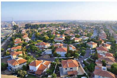
מבט לכיוון דרום ממגדל המים ביבנה, (עיריית יבנה, Wikipedia)

יבנה היא עיר הנמצאת במישור החוף הדרומי. היא נזכרת כבר בתנ"ך בשם יבנאל, כאחת מהערים שנחלת שבט יהודה. בתקופת המשנה התפרסמה יבנה בזכות חכמיה, לאחר שרובן יוחנן בן זכאי ביקש וקיבל רשות מהרומאים להעביר אליה את המרכז הרוחני והתורני של העם, בעקבות חורבן ירושלים. הסנהדרין ישבה ביבנה כשבעים שנה, כשבראשה רבן יוחנן בן זכאי ואחריו רבן גמליאל דיבנה, והחכמים תיקנו תקנות רבות לחיזוק התורה בעם ישראל. בימי הביניים נכבשה יבנה בידי המוסלמים והצלבנים. היישוב היהודי במקום התחדש לאחר הקמת המדינה, בתחילה כמועצה מקומית בשם כפר יבנה, ולאחר מכן כעיר המונה היום קרוב ל-50,000 תושבים.