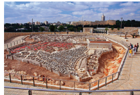
דגם ירושלים בשלהי בית שני, במבט מדרום