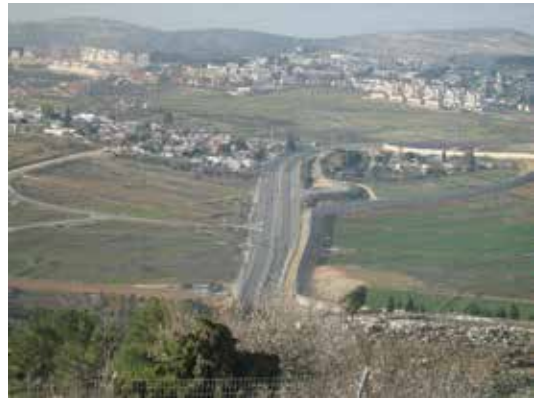
מבט מקבר שמואל על גבעת זאב ומחנה גבעון