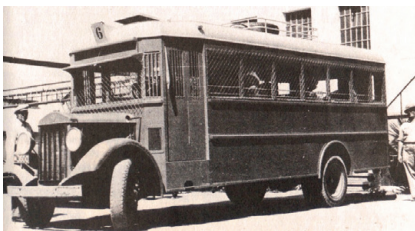
אוטובוס יהודי המכוסה במגנים נגד זריקת רימונים ואבנים, שנות השלושים

המרד הערבי הגדול, המכונה גם מאורעות תרצ"ו-תרצ"ט, היה מרד מאורגן שפרץ בארץ בשנת תרצ"ו. מטרת הערבים במרד היו למנוע הקמת מדינה יהודית, לפגוע בהתיישבות ולשכנע את הבריטים לקבל את דרישות הציבור הערבי. במהלך המרד תקפו הערבים יישובים יהודים, מוסדות בריטים ונציגי שלטון, ובנוסף לכך הכריזו על שביתה כללית כדי לפגוע במשק. למעלה מ-400 יהודים נרצחו במאורעות, ומספר יישובים קטנים נחרבו או ננטשו. המרד לא השיג את מטרותיו, ובסופו של דבר גרם יותר נזק לערבים מאשר ליישוב היהודי, שהמשיך לגדול ולהתחזק.