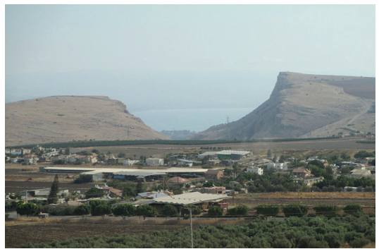
הר הארבל (מימין), הר ניתאי, מושב ארבל ובקעת ארבל

בקעת ארבל נמצאת בגליל המזרחי, ממערב לטבריה. שטחה הוא כ-24 ק"מ רבועים. היא נקראת על שם היישוב ארבל שהיה קיים בה בתקופת בית שני, ובו גרו כוהנים. יישובים יהודים נוספים התקיימו באזור, ביניהם כפר ח'טייה ומגדל צבעי. בתלמוד הירושלמי מסופר על חכמים שהלכו בבקעת ארבל וראו את השמש בזריחתה, ותיארו את הזריחה כמשל לגאולתם של ישראל. התנא ניתאי הארכלי היה תושב המקום. כיום יש בבקעת ארבל מספר יישובים יהודים, ביניהם ארבל, כפר זיתים, כפר ח'טים ומצפה.