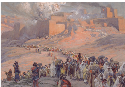
ד"אק טיסו יוצר תמונת-ברית האסירים. תיאור מסע הגלות.

כאשר החריב נבוכדנאצר מלך בבל את בית המקדש הראשון, הוא הגלה את רוב היהודים שהיו בארץ לבבל. הייתה זו האחרונה בסדרת הגלויות שהחלה 11 שנים קודם, כאשר הגלה נבוכדנאצר לבבל את "החרש והמסגר" - בכירי השלטון והנכבדים שביהודה. הנביא ירמיהו הורה לגולים לקנות בתים ולהקים משפחות בבבל, משום שיחלפו שבעים שנה עד לבניין בית שני. ואכן, כעבור שבעים שנה כבש כורש מלך פרס את בבל, ונתן רשות ליהודים היושבים בה לחזור לארץ ולבנות מחדש את בית המקדש. חלק מיהודי בבל עלו לארץ בהנהגת זרובבל ויהושע הכהן הגדול, ואחרים עלו מאוחר יותר עם עזרא ונחמיה, אולם קהילה יהודית גדולה המשיכה להתקיים בבבל.