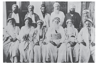
רבנים בבגדאד 1906

הקהילה היהודית בבבל נוסדה על ידי היהודים שהוגלו לשם מיהודה עם חורבן בית ראשון, ונשארו שם גם לאחר הקמת בית שני. בתקופת בית שני ואחריו הלכה יהדות בבל וגדלה, והפכה למרכז רוחני חשוב, בו פעלו הישיבות הגדולות בסורא, פומבדיתא ונהרדעא. בבבל נכתב התלמוד הבבלי, היצירה המרכזית של התורה שבעל פה. לאחר חתימת התלמוד פעלו בבבל הסבוראים והגאונים. במאה ה-11 החל מצבם של יהודי בבל להידרדר, ויהודים רבים עזבו את המקום, עד לסגירת הישיבות וביטול מוסד הגאונות. הקהילה היהודית בבבל המשיכה להתקיים עד הקמת מדינת ישראל, כאשר אז עלו מרבית היהודים לארץ במבצע עזרא ונחמיה, ואחרים עזבו מאוחר יותר, עד שהקהילה להתקיים.