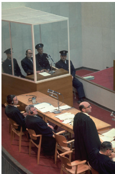
משפט אייכמן. גדעון האוזנר עומד, לשמאלו רוברט סרווציוס. אייכמן יושב במרכז (Wikipedia)

בשנת 1961 תש"א התקיים בישראל משפטו של אדולף אייכמן, מבכירי השלטון הנאצי שהיה אחראי לביצוע תוכנית "הפתרון הסופי" ולרציחתם של מיליוני יהודים. אייכמן נחטף על ידי המוסד מארגנטינה, שם חי בזהות בדויה, והובא לישראל כדי לעמוד לדין. בראש התביעה עמד היועץ המשפטי לממשלה, גדעון האוזנר. המשפט עורר רגשות עזים בציבור בארץ, וניצולי שואה רבים חשפו לראשונה את סיפוריהם כאשר העידו במהלך המשפט. אייכמן טען להגנתו שרק מילא פקודות והיה בורג קטן במערכת. השופטים משה לנדוי, בנימין הלוי ויצחק רווח דחו את טענותיו ודנו אותו למוות בתלייה. אייכמן הוצא להורג, גופתו נשרפה ואפרו פוזר בים.