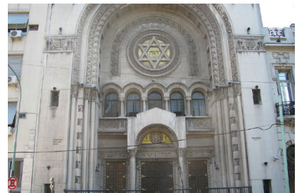
הכניסה לבית הכנסת המרכזי בבואנוס איירס Templo Libertad

היהודים הראשונים הגיעו לארגנטינה במאה ה-16 יחד עם הכובשים הספרדים, לאחר שנמלטו מפני האינקוויזיציה בספרד, אולם רובם התבוללו באוכלוסייה המקומית. קהילות מבוססות התגבשו בארגנטינה במאה ה-19, ויהודים רבים הגיעו לשם מרוסיה, צרפת ומקומות אחרים. בסוף המאה ה-19 ייסד הברון מוריס דה הירש מפעל התיישבות חקלאי בארגנטינה, שבעקבותיו הגיעו למקום עשרות אלפי יהודים ומספרם גדל ל-125,000. לאורך המאה ה-20 המשיכו יהודים להגר לארגנטינה ממזרח אירופה, האימפריה העות'מנית וצפון אפריקה. כיום חיים בארגנטינה קרוב לרבע מיליון יהודים, הקהילה מגובשת מאוד ומחזיקה בתי ספר יהודים ומאות בתי כנסת. יהודי ארגנטינה שומרים על קשרים טובים עם מדינת ישראל, ורבים מהם עלו לארץ.