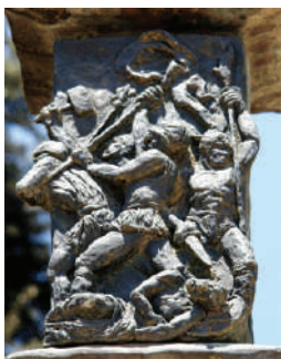
מרד החשמונאים, על פי האמן בְּנו אלקו ביצירתו מנורת הכנסת Wikipedia, Tamar (HaYardeni)

בשנת ג' תקצ"ד מלך ביהודה אנטיוכוס הרביעי, שביקש לעקור ולהשמיד את הדת היהודית על ידי גזרות קשות ואכזריות ביותר. חייליו שידעו כי היהודים שומרי שבת בחרו לתקוף את היהודים דווקא ביום זה והיהודים נמנעו להילחם חזרה מפאת קדושת השבת. בעת שהגזרות הגיעו לעיר מודיעין, קם ראש משפחת הכהנים, מתתיהו החשמונאי והחליט להילחם ברצון היוונים להשמיד את הדת היהודית. הוא הרס את מזבח האלילים והכריז על מרד באומרו: "אם כל העמים אשר בבית מלכות המלך ישמעו לו לסור כל איש מדת אבותיו וימצאו חפץ במקודותיו, אני ובני ואחי נלך בברית אבותינו. חלילה לנו לעזוב את התורה והמצוות, ולדברי המלך לא נשמע לסור מדתנו ימינה או שמאלה." (ספר המכבים א'). מתתיהו, בנו ושאר המורדים ברחו אל ההרים ומשם ניהלו את קרבות המרד ביוונים.