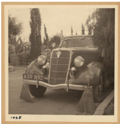
רכב לפינוי מסמרים מהכביש, 1936

המרד הערבי הגדול, המכונה גם מאורעות תרצ"ו-תרצ"ט, היה מרד מאורגן שפרץ בארץ בשנת תרצ"ו. מטרת הערבים במרד היו למנוע הקמת מדינה יהודית, לפגוע בהתיישבות ולשכנע את הבריטים לקבל את דרישות הציבור הערבי. במהלך המרד תקפו הערבים יישובים יהודים, מוסדות בריטים ונציגי שלטון, ובנוסף לכך הכריזו על שביתה כללית כדי לפגוע במשק. למעלה מ-400 יהודים נרצחו במאורעות, ומספר יישובים קטנים נחרבו או ננטשו. המרד לא השיג את מטרותיו, ובסופו של דבר גרם יותר נזק לערבים מאשר ליישוב היהודי, שהמשיך לגדול ולהתחזק.