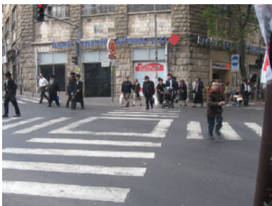
כיצר השבת- מאה שערים