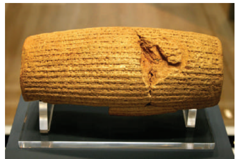
הגליל של כורש

בשנת 539 לפנה"ס כבש כורש מלך פרס את בבל, והביא את סופה של הממלכה הבבלית. בעקבות זאת פרסם הכרזה בה הוא מרשה ליהודים שבבבל לחזור לארצם ולבנות בה את בית המקדש. הכרזה זו הייתה חלק מהמדיניות שלו, בה הוא איפשר גם לעמים אחרים חופש דת. נוסח הצהרת כורש מופיע בספר עזרא, וכמו כן נמצא בהריסות העיר בבל גליל חימר שעליו כתובה ההכרזה באכדית. בעקבות הכרזת כורש עלו עשרות אלפי יהודים מבבל לארץ ישראל, כשהם לוקחים איתם את כלי המקדש שהחזיר להם כורש, חידשו את היישוב היהודי בארץ והחלו לבנות את בית המקדש השני. בשל מעשיו אלה זכה כורש לדברי שבח מפי הנביאים וחז"ל.