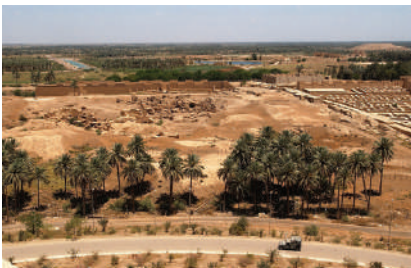
הריסות העיר בבל כפי שנשקפו מארמונו של סדאם חוסיין ב-2003 (Wikipedia)

בבל הייתה ממלכה קדומה באזור עיראק של היום. ראשיתה הייתה בעיר בבל, שהייתה אחת הערים הגדולות והחשובות במזרח הקדום. העיר נחרבה בידי סנחריב בשנת 689 לפנה"ס, אך לאחר מכן נבנתה מחדש. אחרי נפילת האימפריה האשורית עלה נבוכדנאצר לשלטון בבבל, פיתח את העיר והפך אותה לממלכה אזורית חזקה. הבבלים שעבדו את ממלכת יהודה, ולאחר שמלכי יהודה התמרדו נגדם, כבשו את ירושלים והגלו את היהודים מארצם. בבל נכבשה בידי הפרסים בהנהגתו של כורש בשנת 539 לפנה"ס, ובכך בא הקץ על הממלכה הבבלית. העיר נחרבה ולא נבנתה מחדש עד היום.