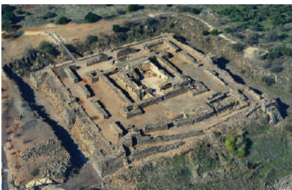
מבט מהאוויר על כוכב הירדן

כוכב הרוחות הוא אתר ארכיאולוגי הנמצא באזור דרום הגליל התחתון וצפון בקעת הירדן, בין הכנרת ובית שאן. הוא נקרא גם כוכב הירדן ויפה נוף. במקום נמצאים שרידים של היישוב "כוכב" מתקופת התלמוד, ביניהם בית כנסת ואבנים עם סמל המנורה, ושרידיה של מצודה צלבנית שנבנתה במאה ה-12. במאה ה-18 נבנה במקום כפר בדואי, שנכבש במלחמת העצמאות. המקום נקרא כך על שם הרוחות החזקות הנושבות בו, וכונה על ידי הצלבנים "יפה נוף" בשל הנוף המרהיב הנשקף ממנו. בשנת 1959 תשי"ט הקים מאיר הר ציון בסמוך למצודה את "אחוזה שושנה", שנקראה על שם אחותו שנרצחה על ידי בדואים במדבר יהודה, ובשנת 2011 הוקמה במקום תצפית על שם הרמטכ"ל דן שומרון. כיום מנוהל האתר על ידי רשות הטבע והגנים.