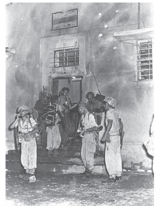
תקיפת תחנת המשטרה הירדנית בקלקיליה, 1956

בשנות החמישים והשישים של המאה ה-20 נקטה ישראל במדיניות של פעולות תגמול בתגובה לפיגועי טרור והתקפות מצד הערבים. את הפעולות הובילו ראש הממשלה דוד בן גוריון והרמטכ"ל משה דיין. התפיסה מאחוריהן הייתה שלא ניתן למנוע כל פיגוע טרור, אבל אפשר לגבות מהאויב מחיר כבד עבור דם יהודי, שיבהיר לו שמעשים כאלה יעלו לו ביוקר. לשם ביצוע פעולות התגמול הוקמה יחידה 101, שהתמזגה בהמשך עם הצנחנים, אך גם כוחות צבא אחרים לקחו בהן חלק. בין פעולות התגמול הידועות היו פעולת קיביה, מבצע חץ שחור, מבצע אלקיים, מבצע לולב ופעולת סמוע.