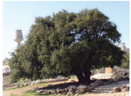
עץ האלון ההיסטורי (האלון הבודד) במרכז גוש עציון, ליד אלון שבות. העץ מזוהה מאוד עם גוש עציון ואף מופיע בסמל המועצה האזורית

גוש עציון הוא קבוצה של יישובים יהודים בין בית לחם לחברון, מדרום לירושלים. לאחר שני ניסיונות התיישבות כושלים, הקימה תנועת הקיבוץ הדתי באזור שלושה יישובים: כפר עציון, משואות יצחק ועין צורים, ותנועת השומר הצעיר הקימה את קיבוץ רבדים. כאשר פרצה מלחמת העצמאות, הטילו הערבים מצור על גוש עציון וניתקו את הגישה אליו. המתיישבים לחמו בגבורה וניסו להחזיק מעמד, אולם יום לפני הכרזת הקמת המדינה נפל כפר עציון, וכל מגיניו נהרגו. שלושת הקיבוצים האחרים נכנעו, תושביהם נלקחו בשבי והיישובים נהרסו. גוש עציון הוקם מחדש אחרי מלחמת ששת הימים, כאשר חזר השטח לשליטת ישראל.