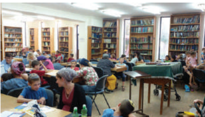
קהילת הלומדים תלמוד ישראלי במסגרת 'הורים ילדים' בכפר עציון (יוחאי כשטר)

כפר עציון הוא קיבוץ דתי הנמצא בגוש עציון. הוא הוקם לראשונה ב-1927 אך ננטש בשל מאורעות תרפ"ט. ב-1935 יושב המקום שנית, ונקרא כפר עציון על שם שמואל צבי הלוצמן, שמשמעות שם משפחתו היא "איש העץ". גם הפעם ננטש היישוב כעבור שנה בשל התנכלויות הערבים. הקיבוץ נוסד מחדש בשנת 1943 על ידי קבוצת אברהם של תנועת השומר הדתי, הראשון מבין ארבעה יישובים שנועדו להגן על ירושלים מדרום. במלחמת העצמאות תקפו הערבים את גוש עציון וניתקו אותו מירושלים. הנשים והילדים פונו מהאזור, והגברים נשארו ולחמו בגבורה עד לנפילת כפר עציון, יום לפני הכרזת המדינה. 242 תושבים נהרגו בקרבות אלה. בשנת 1967 הוקם כפר עציון מחדש על ידי ילדיהם של התושבים המקוריים. כיום מונה הקיבוץ כ-180 משפחות.