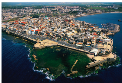
עכו (Wikipedia, AERIAL VIEW OF ACRE)

עכו היא עיר נמל בצפון ארץ ישראל, לחוף הים התיכון. היא מוזכרת כבר בתנ"ך בספר שופטים, ושימשה כעיר נמל חשובה בתקופת בית שני ואחריו, וכמקום מגוריהם של כמה תנאים ואמוראים. בסוף המאה ה-13 נחרבה עכו בידי הממלוכים, ויושבה מחדש רק כעבור מאות שנים. בתקופת המנדט הבריטי התיישבו בעיר יהודים רבים. הבריטים השתמשו במצודה שעמדה במקום כבית כלא וגרדום, בו הוחזקו אסירים יהודים מפורסמים. במלחמת העצמאות נכבשה עכו בידי צה"ל, ותושביה הערבים נמלטו או נכנעו. כיום זוהי עיר מעורבת בה חיים יחד יהודים וערבים. בסביבתה נמצאים אתרים ארכיאולוגיים רבים ומבנים מתקופות קדומות.