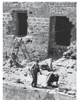
קיר הכלא לאחר הפריצה