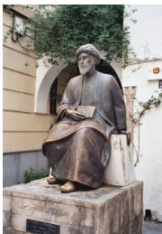
פסלו של הרמב"ם בקורדובה

יהודים ישבו בספרד כבר בתקופת בית שני, ויש הסבורים שעוד קודם לכן. הם ישבו בעיקר בערי החוף המזרחי ובדרום, וביניהן בקורדובה, גרנדה וטולדו. כאשר כבשו המוסלמים את ספרד מידי הנוצרים בשנת 711, החלה התקופה המכונה תור הזהב של ספרד. יהודים רבים הגיעו לתפקידים חשובים ורבי השפעה, ועסקו ביצירה תורנית, בפילוסופיה ובשירה. בין אותם יהודים היו ר' שלמה אבן גבירול, ר' יהודה הלוי, ר' שמואל הנגיד, והרמב"ם, שנולד וגדל בקורדובה. תור הזהב הגיע לקצו בסוף המאה ה-11, כאשר השושלת המוסלמית אל-מוראביטון כבשה את האזור ורדפה את היהודים בשטחה. רבים מיהודי קורדובה נהרגו, ואחרים נמלטו. הקהילה היהודית התחדשה מאוחר יותר, ונמשכה עד לגירוש ספרד ב-1492.