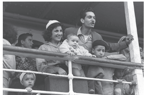
עולים חדשים ממרוקו בשנת 1954

יהודים עלו ממרוקו לארץ ישראל לאורך כל הדורות. עם הקמת המדינה ופרוץ מלחמת העצמאות החריף היחס העויין כלפי היהודים במרוקו, והחל גל עלייה גדול לארץ. בשנים 1948-1956 הייתה מרוקו תחת שלטון צרפתי, שאיפשר ליהודים לעלות לארץ תחת מגבלות. בשנים אלה עלו 85,000 יהודים. בחמש השנים הבאות נאסרה ההגירה, אך 30,000 יהודים הצליחו לעלות לארץ באופן לא חוקי בספינות מעפילים. בשנים 1961-1967 עלו לארץ 120,000 יהודים במסגרת מבצע יכין, בהסכמה בשתיקה מצד השלטונות. סך הכל עד שנת 2000 עלו ממרוקו לארץ קרוב לרבע מיליון יהודים, ורק אלפים בודדים נותרו שם.