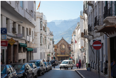
רחוב בתטואן

תטואן היא עיר בצפון מרוקו. בעקבות גירוש ספרד נוסדה במקום קהילה יהודית של מגורשי ספרד שדיברה לאדינו. השכונה היהודית נקראה מלאח ושכנה בדרום רובע המדינה. בשל רבניה הגדולים של העיר היא כונתה "ירושלים של מרוקו" או "ירושלים הקטנה", והקהילה הייתה ידועה בחינוך הטוב שהעניקה לילדיה. בשנת 1798 נערך פוגרום בתושבים היהודים, וכך גם ב-1859, כאשר פלשו הספרדים לעיר. בתחילת המאה ה-20 מנו יהודי תטואן כ-20% מתושבי העיר, אולם רובם עזבו אותה והיגרו לארץ ישראל או לארצות אחרות.