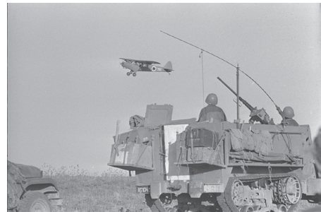
מטוס סיור קל של חיל האוויר מעל הכוחות הישראליים ברמת הגולן

במלחמת ששת הימים תקפו הסורים את ישראל מצפון, בהתקפות אוויריות וקרקעיות. כאשר הסתיימו הקרבות בסיני ובחזית הירדנית התפנה צה"ל להשיב מתקפה נגד הסורים. ב-9 ביוני השתלטו כוחות צה"ל על מוצבי הקו הראשון של הסורים, ובהמשך התקדמו מזרחה וכבשו שטחים נרחבים ברמת הגולן. הכוחות הסורים היו בנסיגה וצה"ל הצליח להשתלט על רמת הגולן ועל החרמון בלי להיתקל בהתנגדות נרחבת. רוב התושבים הסורים שגרו ברמת הגולן נמלטו ממנה. עם סיום המלחמה הייתה רמת הגולן בידי ישראל, מהחרמון בצפון עד הירמון בדרום, ובכך הוסר האיום הסורי מעל יישובי הכנרת ועמק החולה.