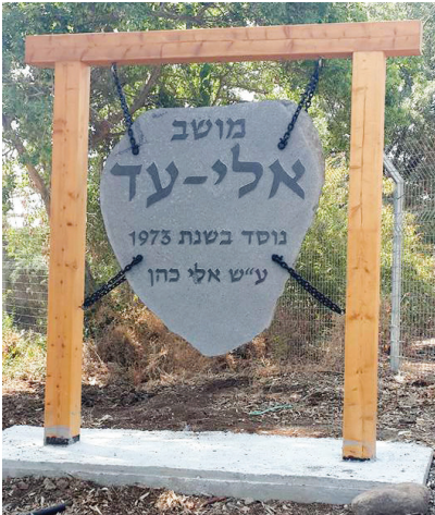
שלט הכניסה למושב

אלי-עד הוא מושב ברמת הגולן. הוא הוקם בשנת 1968 ונקרא בתחילה "אל על", ובשנת 1999 שונה שמו ל"אלי-עד", על שם המרגל הישראלי אלי כהן. גרעין המושב היה במבנים של מחנה צבאי סורי שננטש במלחמת ששת הימים. בעקבות סכסוכים שונים עזבו רוב המתיישבים את המקום, והוקמה בו היאחזות נח"ל. בשלב מסוים ננטש היישוב, ובשנת 1973 הגיע אליו גרעין אלי-עד של הנח"ל שיישב אותו מחדש. כיום גרים במושב כ-400 תושבים, העוסקים בעיקר בחקלאות וגידול בקר.