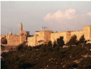
חומות ירושלים העתיקה כפי שנראות כיום

ירושלים הייתה מאז הקמתה עיר מוקפת חומות, שנועדו להגן עליה מפני התקפות. לאורך ההיסטוריה חרבו חומות ירושלים ונבנו מחדש פעמים רבות. חומות חדשות נבנו עם התרחבותה של העיר. החומות המקיפות את העיר העתיקה היום אינן החומות שהובקעו בי"ז בתמוז על ידי הרומאים, אלא נבנו במאה ה-16 על ידי הסולטאן סולימאן המפואר. אורכן הוא כארבעה וחצי קילומטרים, גובהן כעשרה מטרים, והן מקיפות אזור של כקילומטר רבוע. בחומות קבועים שמונה שערים, שאחד מהם סתום (שער הרחמים). חומות אלה משמשות כיום כאתר תיירות וכסמל לירושלים העתיקה.