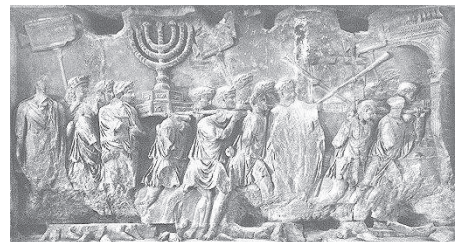
תבליט משער טיטוס בו נראית תהלוכת ניצחון של לגיונרים רומאים הנושאים שלל מבית המקדש (Wikipedia)

בשנת 70 לספירה הצליחו הרומאים לכבש את המרד הגדול שפרץ ביהודה. המצביא טיטוס, בנו של אספסיינוס, כבש את ירושלים, החריב אותה ושרף את בית המקדש. יהודים רבים נהרגו, ורבים אחרים נפלו בשבי. במסגרת חגיגות הניצחון שלו, הכריח טיטוס את השבויים היהודים להילחם בזירה זה בזה או בחיות טרף, והרג אותם בדרכים אכזריות. כאשר חזר לרומא הצעיד איתו שבויים רבים בתהלוכת ניצחון המכונה "טריומף", בה הוצגו לראווה כלי המקדש שנבזזו. בראש התהלוכה צעד שמעון בר גיורא, אחד ממנהיגי המרד, שהוצא להורג בסופה. מאוחר יותר הונצחה התהלוכה בתבליט על שער טיטוס שנבנה לכבודו.