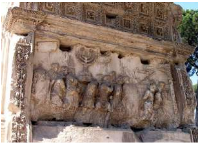
תבליט המתאר את הטריומף (מצעד ניצחון) בשער רומא (Wikipedia, Dnalor 01)

שער טיטוס נמצא ברומא. הוא נקרא על שמו של טיטוס, המצביא הרומאי שהחריב את בית המקדש השני. את השער בנה אחיו של טיטוס, דומיטיאנוס, בשנת 82 לספירה, כדי לפאר את ניצחונו על היהודים. גובה השער 15.4 מטרים ורוחבו 13.5 מטרים. על השאר מופיעים תבליטים שונים, שבאחד מהם נראים חיילים רומאים נושאים את כלי המקדש, ביניהם מנורת הזהב, ויהודים שנלקחו בשבי. יהודי רומא נהגו שלא לעבור דרך שער טיטוס, אולם ביום ההכרזה על הקמת מדינת ישראל בתש"ח הם צעדו דרכו בכיוון ההפוך, כדי לסמל את השיבה מרומא לארץ ישראל. צורת המנורה שמופיעה על השער מופיעה על סמל מדינת ישראל.