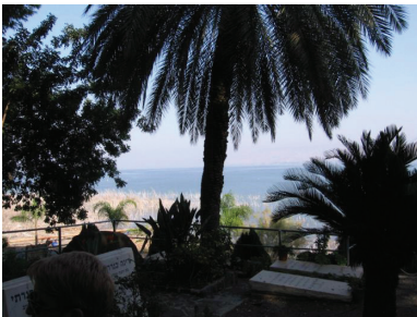
בית הקברות כנרת

בית הקברות כנרת נמצא ליד הכנרת. הוא נחנך בשנת 1911 ושימש את תושבי המושבה כנרת וקבוצת כנרת. הראשון שנקבר במקום היה מנחם מנדל שמואלביץ, ועם השנים נקברו בו אישים ידועים רבים, ביניהם נעמי שמר, רחל המשוררת, ברל כצנלסון, אברהם הרצפלד ואחרים. בבית הקברות יש גם חלקה מיוחדת לעולים מתימן שהתיישבו בכנרת, וחלקה ליהודים שגורשו מתל אביב בשנת 1917 וסבלו מתנאים קשים. אנשים רבים מבקרים במקום כדי להזדהות עם האישים הקבורים בו ולקבל מהם השראה.