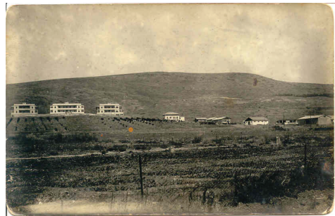
שלושת הבתים הראשונים בקבוצת כנרת, בשנות ה-20. במבנה המרכזי מבין שלושת הבתים על הגבעה, שוכן מוזיאון לתולדות כנרת