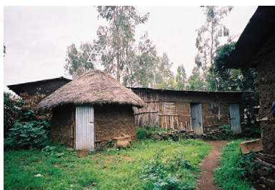
בית הכנסת בכפר וולקה שבאתיופיה (2003)

הקהילות היהודיות באתיופיה היו ידועות בכינוי "ביתא ישראל". יהודים גרו באפריקה כבר בתקופת בית ראשון, וקיימות השערות שונות לגבי מוצאה המדויק של הקהילה. בשל בידודם מקהילות יהודיות אחרות, שמרו יהודי אתיופיה על מנהגים והלכות שונות משל השאר. הם לא העלו את התורה שבעל-פה על הכתב אלא העבירו את המסורות הפרשניות בעל פה. ביתא ישראל שכנו בעיקר בצפון-מערב אתיופיה, באזור חבש ההיסטורית, בשוואה ובאדיס-אבבה. למרות מאבקים רבים עם שכניהם הנוצרים, שמרו היהודים על דתם, ולאורך הדורות התפללו לעלות לארץ ישראל ולירושלים.