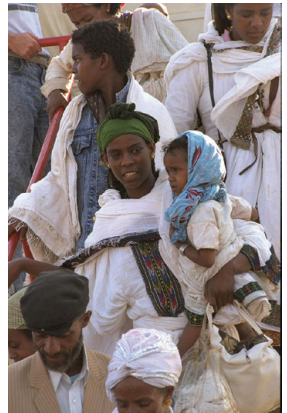
עולים חדשים מאתיופיה יורדים ממטוס לאחר הגעתם במסגרת מבצע שלמה מאדיס אבבה

ראשוני העולים מאתיופיה בתקופה המודרנית הגיעו לארץ ב-1934, יחד עם עולים מתימן. בשנים הראשונות להקמת המדינה לא נערכו מבצעים להעלאת יהודי אתיופיה לארץ, אולם בעקבות פרוץ מלחמת האזרחים באתיופיה והידרדרות מצבם של היהודים שם הוחלט לפעול להצלתם. במהלך מבצע אחים, שהתקיים בין השנים 1979-1990, נקראו יהודי אתיופיה להגיע למחנות פליטים בסודאן, ומשם הובאו לארץ. מבצע זה כלל מבצעים נוספים, ביניהם מבצע משה, מבצע מדיון שבויים ומבצע שלמה. סך הכל עלו לארץ כ-16,000 איש. כיום מונים יוצאי אתיופיה בישראל מעל 126,000 איש.