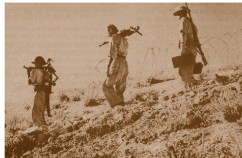
לוחמי הגדוד הראשון של הפלמ"ח בקרב משמר העמק, אפריל 1948

הפלמ"ח, "פלוגות המחץ", הוקם ביוזמת הצבא הבריטי בשנת 1941 כדי לסייע בהגנה על היישוב היהודי מפני האיום הנאצי המתקרב. בראש הפלמ"ח עמדו אנשים ששירתו יחד במסגרת הפלוגה הנוודדת ופלוגות השדה, ואת הפיקוד על היחידה קיבל יצחק שדה. בפעולות הראשונות סייע הפלמ"ח לצבא הבריטי בלבנון. לאחר הניצחון על הנאצים הפסיקו הבריטים לממן את הפלמ"ח, והוא ירד למחתרת ושימש ככוח הצבאי של ההגנה, הגן על היישובים ובהמשך השתתף במאבק נגד הבריטים. לאחר הקמת המדינה פורק הפלמ"ח ושולב בצה"ל.