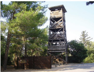
שחזור חומה ומגדל בחנייה תחתית

קיבוץ חנייה נמצא בגליל המערבי. הוא הוקם בשנת 1938 במסגרת יישובי "חומה ומגדל", על ידי 100 מתנדבים מפלוגות השדה בפקודו של יצחק שדה. בשל מיקומו המבודד והקשה להגנה של היישוב סבלו המתיישבים התקפות ואבידות, עד שהצליחו להתבסס במקום. כיום חיים ביישוב כ-760 תושבים המתפרנסים מחקלאות ותעשייה. במקום נמצא מוזיאון חנייה, ובו אביזרים ומסמכים מתקופת חומה ומגדל, וכן ממצאים ארכיאולוגיים מהיישוב הקדום שעמד במקום בתקופת בית שני.