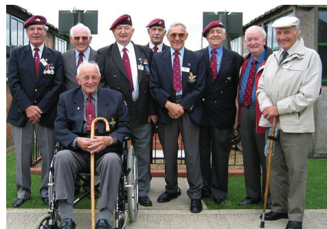
ותיקי הכלניות ששרתו באי במפגש, 'קמפ עדן', יורקשייר, אנגליה 2005

הבריטים כבשו את ארץ ישראל במלחמת העולם הראשונה, וקיבלו מנדט לשלוט בה. בספטמבר 1945 הוצבה בארץ הדיוויזיה המוטסת הבריטית השישית, שהייתה שייכת לצנחנים וחייליה חבשו כומתות אדומות. השלטון הבריטי עורר עוינות רבה בקרב היהודים בארץ, בשל המגבלות שהציב לעליית יהודים ובשל תמיכתו בערבים. הצנחנים הבריטים כונו "כלניות", כרמז לכך שיש להם כומתות אדומות אך לב שחור. ילדים היו שרים את השיר "כלניות" לעבר החיילים, שנפגעו ממנו מאוד. בשלב מסוים אף אסרו הבריטים על השמעת השיר, אך האיסור בוטל תוך זמן קצר.