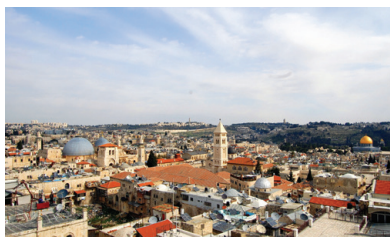
העיר העתיקה (Wikipedia, אני)

העיר העתיקה בירושלים היא האזור העתיק של העיר. היא נבנתה בתקופה הכנענית, ודוד המלך הפך אותה לבירתו. בתחומה נמצא הר הבית, עליו עמדו בית המקדש הראשון והשני. העיר העתיקה מחולקת לארבעה רבעים - היהודי, המוסלמי, הארמני והנוצרי, ושמונה שערים נמצאים בחומותיה. היא נבנתה ונהרסה לסירוגין במשך אלפיים שנה, ונמצאים בה שרידים של מבנים רבים מתקופות קדומות. במלחמת העצמאות השתלטו הירדנים על העיר, אולם היא שוחררה מחדש בידי ישראל במלחמת ששת הימים. כיום גרים בעיר העתיקה כ-39,000 תושבים, מתוכם כ-3,000 יהודים.