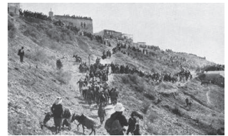
עלייה לרגל לקבר הרשב"י, 1920

מדי שנה מתקיימת בל"ג בעומר הילולת רבי שמעון בר יוחאי ליד קברו במירון. עלייה לקברי הצדיקים במירון מוזכרת כבר במאה ה-11, והעלייה לקבר רשב"י מופיעה לראשונה בכתבי ר' חיים ויטאל במאה ה-16. לפי המסורת נחשב ל"ג בעומר ליום פטירתו של רשב"י, בו גילה לתלמידיו את סודות הקבלה, ולכן חוגגים ביום זה לכבודו. במשך הזמן התפתחו המנהגים הקשורים להילולה, כמו הדלקת מדורות וגרות, סעודות ותספורות "חלאקה" לילדים. כיום הילולת רשב"י היא אחד מהאירועים ההמוניים הגדולים ביותר, ומאות אלפי אנשים מגיעים למירון ומשתתפים בה מדי שנה.