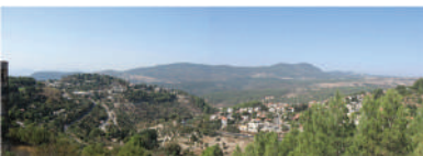
רכס הרי מירון מכיוון צפת

מירון הוא מושב דתי בגליל העליון, שנקרא על שם העיר הקדומה מירון ששכנה בסמוך בתקופת המשנה. הוא הוקם בשנת 1949 על חורבות כפר ערבי שנכבש במלחמת העצמאות. מייסדי המושב היו חיילים שהשתתפו בשחרורו, ועולים מרומניה והונגריה. כיום גרים ביישוב כ-1,000 תושבים, המתפרנסים בעיקר מחקלאות ותיירות. בחלקו הדרומי של המושב נמצא קבר רבי שמעון בר יוחאי, אליו מגיעים מבקרים רבים לאורך השנה ובפרט בל"ג בעומר. כמו כן, ישנם קברי תנאים ואמוראים נוספים בסביבת המושב, וכן חורבה של בית כנסת עתיק.