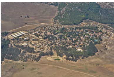
קיבוץ מגידו

קיבוץ מגידו הוקם בשנת 1949 - תש"ט לפני סיום מלחמת השחרור. הוא נקרא על שם העיר העתיקה מגידו, הנמצאת על תל סמוך, שהוקמה באלף השלישי לפנה"ס והתקיימה עד התקופה הפרסית. הגרעין המייסד של הקיבוץ הורכב מפליטי שואה, פרטיזנים ולוחמים מפולין ומהונגריה שהתארגנו בתום מלחמת העולם השנייה ועלו כמעפילים לא חוקיים. את הצריפים הראשונים הקימו על גבעה חשופה והתחילו לפתח משק חקלאי. בשנת 2003 תשס"ג הופרט הקיבוץ, וכיום הוא מתנהל כיישוב קהילתי. במקום נמצאים מוזיאון ושרידים ארכיאולוגיים חשובים.