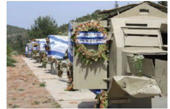
שרידי משוריינים בשער הגיא

במהלך מלחמת העצמאות עמדה ירושלים במרכזם של קרבות רבים. הערבים השתלטו על הדרכים המרכזיות המובילות לחלקה היהודי של העיר, ומנעו מעבר של שיירות לוחמים, מזון ואספקה. ניסיונות רבים נעשו לפרוץ את המצור באמצעות שיירות משוריינים ולהשתלט על הדרכים, והכוחות היהודים ספגו אבידות קשות במהלך קרבות אלה. שער הגיא, המכונה בערבית באב-אל-ואד, היה אחד הפתחים דרכו ניסו הלוחמים להגיע לירושלים. כיום ניצבים לאורכו משוריינים רבים שנפגעו במהלך ניסיונות אלה, ומשמשים כאנדרטה לזכרם של הנופלים.