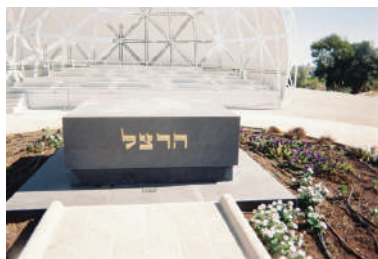
המצבה על קברו של בנימין זאב הרצל (Wikipedia)

הר הרצל נמצא במערב ירושלים. הוא נקרא על שם בנימין זאב הרצל, שנקבר שם על פי בקשתו בשנת 1949. בהמשך הוקמו במקום בית קברות אזרחי, בית הקברות הצבאי הראשי וחלקת גדולי האומה, בה קבורים נשיאים וראשי ממשלות, וכן היכל הזיכרון הממלכתי לחללי ישראל. כמו כן נמצאים במקום מוזיאון הרצל, מדרשת הר הרצל וגן האומות, שנטע על ידי ראשי מדינות שביקרו בארץ. מדי שנה, בערב יום העצמאות, נערך בהר הרצל טקס הדלקת המשואות הפותח את אירועי יום העצמאות.