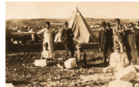
אנשי גדוד העבודה בונים את ביתו של אליעזר בן-יהודה (עומד מימין לאוהל)

גדוד העבודה היה ארגון חלוצי שפעל בארץ בשנים 1920-1929. הוא הוקם על ידי אנשי "החלוץ" ו"השומר", חניכיו של יוסף טרומפלדור, כחצי שנה אחרי מותו. מטרתו היו לפעול לחיזוק ההתיישבות וההגנה בארץ ישראל, והוא התנהל בצורה שיתופית. חברי הגדוד עסקו בייבוש ביצות, סלילת כבישים, הקמת יישובים, חקלאות ועוד. הם בנו מספר שכונות בירושלים ותל אביב, והקימו את היישובים עין חרוד, תל יוסף ורמת רחל. כ-2,500 אנשים היו חברים בגדוד העבודה לאורך שנות קיומו, עד שהתפרק בעקבות קשיים כלכליים וחילוקי דעות.