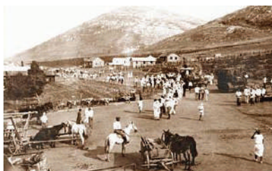
עין חרוד בראשית שנות העשרים (Wikipedia)

עין חרוד הוא קיבוץ בעמק יזרעאל, שהוקם בשנת תרפ"א על ידי אנשי גדוד העבודה והשומר, ונקרא על שם מעין חרוד שלידו הוא יושב. כעבור שש שנים עבר היישוב למקום הקבע שלו. הרב קוק ביקר בקיבוץ במהלך מסע הרבנים, וקרא לתושבים לקיים מצוות ולהתחתן כהלכה. בשנת 1952 התפלג הקיבוץ בעקבות חילוקי דעות בתנועת העבודה והקיבוץ המאוחד, והפך לשני קיבוצים בשם "עין חרוד איחוד" ו"עין חרוד מאוחד". בכל אחד מהם גרים כיום כמה מאות תושבים. בין תושבי עין חרוד הידועים היו יצחק טבנקין, מאיר הר-ציון ואברהם שלונסקי.