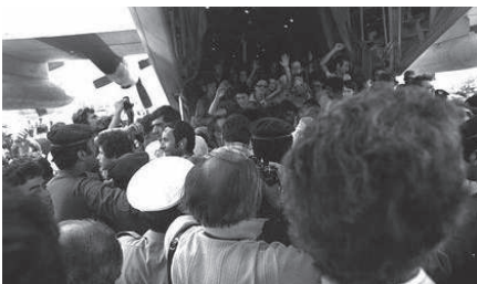
קבלת הפנים לכוחות השבים עם החטופים בשדה התעופה בישראל

מבצע יונתן , המכונה גם מבצע אנטבה ו"כדור הרעם", הוא שמה של פעולה צבאית שביצע צה"ל באוגדה ב-ו' תמוז תשל"ו (4 ביולי 1976) כדי לשחרר 105 נוסעים יהודים, ישראלים ואנשי צוות מטוס אייר פראנס, שנחטפו על ידי טרוריסטים במהלך טיסתם מירושלם לצרפת. מבצע זה היה מסוכן ונועז במיוחד, שכן החטופים הוחזקו במדינה עוינת ורחוקה. הוא הוצא לפועל בשל סירובה של ישראל להיענות לדרישות החוטפים ולשחרר אסירים ביטחוניים. לוחמי סיירת מטכ"ל וצנחנים הונחתו באנטבה בחשאי ממטוסי תובלה והצליחו להשתלט על שדה התעופה, להרוג את המחבלים ולהחזיר לארץ את רוב בני הערובה. במהלך המבצע נהרג מפקד סיירת מטכ"ל, יונתן (יוני) נתניהו, ובעקבות זאת נקרא המבצע על שמו.