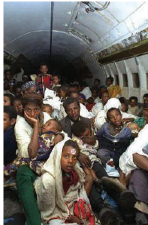
בתוככי אחד המטוסים במבצע שלמה

מבצע שלמה (שהתקיים ב"א-י"ב סיון תשנ"א, 24-25 במאי 1991) היה מבצע להעלאתם לארץ של יהודי ביתא ישראל מאתיופיה. המסע הנועז התבצע באמצעות רכבת אווירית שכללה 30 מטוסים, שפינו 14,310 יהודים בתוך כ-36 שעות. המבצע נקרא על שם שלמה המלך שפגש את מלכת שבא, שלפי המסורת האתיופית היא בת ארצם. האירוע שדרבן את הוצאת המבצע אל הפועל הוא נפילת השלטון באתיופיה בידי מורדים, אירוע שעורר חשש לגורלם של היהודים שם. על המבצע פיקד אמנון ליפקין-שחק והשתתפו בו גם הג'וינט, "המוסד", השב"כ וכ-70 לוחמים מיחידת שלדג, שאבטחו את אזור נמל התעופה. במבצע נקבע שיא עולמי לאחר ש-1,087 איש הוטסו במטוס בואינג 747 של חברת אל על.