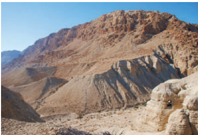
נחל קומראן ומערה מס' 4 מימין

מערות קומראן נמצאות באזור ים המלח, ליד נחל קומראן. הן התגלו בשנת 1946 על ידי נער בדואי, שחיפש אחר עז שאבדה לו. בתוך המערה גילה הנער כדי חרס ובתוכם מגילות עתיקות מתקופת בית שני, שנקראו לאחר מכן "מגילות ים המלח". בעקבות מציאת המערות נערכו חפירות ארכיאולוגיות במקום, ונתגלו בו שרידי יישוב וממצאים רבים מאותה תקופה. החוקרים משערים שתושבי כת האיסיים, והמגילות מלמדות על אורח חייהם ואמונותיהם.