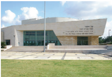
מרכז תרבות וחברה באור עקיבא

אור עקיבא היא עיר במחוז חיפה, שהוקמה ב-1951 על ידי קבוצת עולים מרומניה, ונקראה בתחילה מעברת חוף הכרמל או מעברת קיסריה. שנתיים לאחר מכן שונה שם היישוב לאור עקיבא, על שם רבי עקיבא שהוצא להורג בקיסריה הסמוכה. עולים רבים מארצות שונות התיישבו במקום לאורך השנים. גל עלייה גדול במיוחד הגיע מברית המועצות בשנת 1992, והביא להקמת שכונות חדשות ושירותים ציבוריים נוספים. כיום גרים במקום כ-18,000 תושבים. עזר ויצמן היה מקורב מאוד לתושבי אור עקיבא, ביקש לא להיקבר בחלקת גדולי האומה בהר הרצל בירושלים, אלא ביקש להיקבר בבית הקברות באור עקיבא, ליד קבר בנו שאול, שאף הוא נקבר שם.