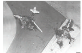
שני מפציצים מצריים שהושמדו על הקרקע

חיל האוויר הישראלי מילא תפקיד מכריע במלחמת ששת הימים. באותו זמן עמדו לרשותו 203 מטוסי קרב. המלחמה נפתחה בהתקפת פתע נרחבת של חיל האוויר הישראלי על בסיסי חילות האוויר של מדינות ערב, במסגרת "מבצע מוקד". רוב מטוסי האויב הושמדו או שותקו, ובכך למעשה הוכרעה המלחמה כבר בתחילתה. 451 מתוך 600 המטוסים שהיו למדינות ערב הושמדו במהלך המלחמה. השליטה האווירית שהושגה אפשרה לחיל האוויר להגיש סיוע לכוחות היבשה הישראליים, לתקוף כוחות שריון וארטילריה של צבאות ערב ולזרז את תבוסתם. 25 טייסים ישראליים נהרגו במלחמה.