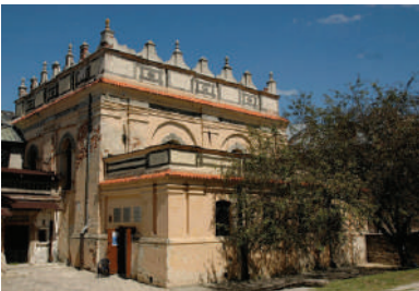
בית הכנסת בזמושץ'

זמושץ' היא עיר בדרום מזרח פולין. היא הוקמה בסוף המאה ה-16 ובני לאומים שונים הוזמנו לגור בה, ביניהם יהודים ממרוקו, טורקיה ארמניה ואיטליה. ליהודים הוענק שוויון זכויות, פטור ממסים למשך 25 שנים, והותר להם לעסוק במקצועות שונים. בעיר קמה קהילה ספרדית גדולה, ובמהלך המאה ה-17 החלו להגיע למקום יהודי אשכנז שנמלטו מפרעות חמילניצקי. עם הזמן הלך מצבה של הקהילה והידרדר, במיוחד לאחר הכיבוש הרוסי ב-1815. ערב השואה חיו בזמושץ' 12,000 יהודים, שהיו קרוב למחצית האוכלוסייה. כמעט כולם נרצחו. הסופר י"ל פרץ היה יליד זמושץ'.