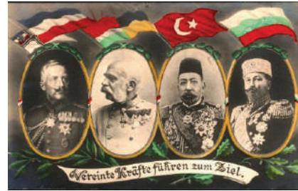
מעצמות המרכז במלחמת העולם הראשונה ומנהיגיהן

מלחמת העולם הראשונה התחוללה בשנים 1914-1918, והשתתפו בה מדינות רבות ברחבי העולם. המלחמה התרחשה בעיקר בין מעצמות המרכז, שכללו את גרמניה, אוסטרו-הונגריה, האימפריה העות'מאנית ובולגריה, לבין מדינות ההסכמה, שכללו את בריטניה, צרפת, רוסיה, איטליה וארצות הברית. האירוע שהצית את המלחמה היה רצח יורש העצר האוסטרי פרנץ פרדיננד, שבעקבותיו פרצו הכרזות מלחמה ונכרתו בריתות בין המדינות השונות. המלחמה, שהייתה הגדולה ביותר בהיסטוריה עד אז, הסתיימה בניצחון מדינות ההסכמה. למעלה מ-16 מיליון בני אדם נהרגו במהלכה.