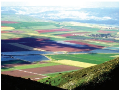
עמק חרוד מצולם מהגלבע

עמק חרוד נמצא בצפון הארץ, ממזרח לעמק יזרעאל. הוא נקרא על שם מעיין חרוד הנמצא ליד הגלבע, שמוזכר בספר שופטים. בתקופת בית ראשון עמדה העיר יזרעאל בין עמק חרוד לעמק יזרעאל, ושימשה כבירת ממלכת ישראל. ההתיישבות החדשה בעמק החלה בשנות ה-20 של המאה העשרים, כאשר יהושע חנקין קנה את האדמות שעליהן הוקמו היישובים עין חרוד, כפר יחזקאל, גבע, תל יוסף, בית אלפא, חפציבה ובית השיטה. האזור היה בתחילה מלא בביצות, אולם הללו נוקזו לתוך ערוץ נחל חרוד והפכו לשטחי חקלאות פוריים. לאחר הקמת המדינה הוקמו באזור היישובים קיבוץ יזרעאל, גדעונה ומעלה גלבע.