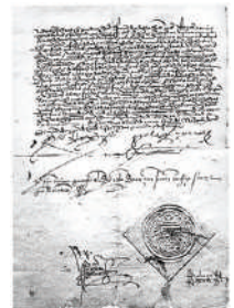
צו הגירוש משנת 1492

עד המאה ה-12 חיו יהודי ספרד תחת השלטון המוסלמי, ונהנו מחופש, השכלה ושגשוג כלכלי. אולם כאשר כבשו הנוצרים את ספרד מידי המוסלמים, הלך יחסם של השלטונות ליהודים ונעשה גרוע יותר. בשנת 1492 חתמו המלך פרדיננד השני והמלכה איזבלה, ביוזמתו של ראש האינקוויזיציה טורקמדה, על צו האוסר על יהודים להמשיך לשבת בספרד, ודרש מהם להתנצר או לעזוב את הארץ. יהודים רבים בחרו להתנצר, לפחות למראית עין, אך רבים אחרים נשארו נאמנים לאמונתם ועזבו את ספרד לארצות אחרות. מספרם המשוער של המגורשים מוערך בין 40,000 ל-160,000. מגורשי ספרד סבלו רבות מהמסע ותלאות הדרכים, ורבים מהם מתו, נפלו בשבי, נשדדו או נרצחו. גירוש ספרד, שהתרחש בסמוך לתשעה באב, נחשב לאחד האסונות הגדולים שפקדו את עם ישראל במהלך הגלות.