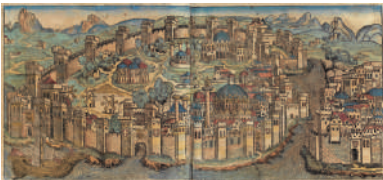
ציר של העיר קונסטנטינופול (Wikipedia)

קונסטנטינופול היא עיר גדולה בטורקיה, שנקראת היום איסטנבול. היא נוסדה במאה השביעית לפנה"ס, ונקראה בתחילה ביזנטיון. בשנת 324 העביר הקיסר קונסטנטינוס את בירת האימפריה הרומאית מרומא לביזנטיון, ושינה את שם העיר לקונסטנטינופוליס, על שמו. היהודים כינו את העיר קושטנדינא, או בקיצור קושטא. בשנת 1453 כבשו הטורקים העות'מאנים את העיר ושינו את שמו לאיסטנבול. במקום התקיימה קהילה יהודית גדולה וחשובה, ורבים ממגורשי ספרד ופורטוגל מצאו בה מקלט. בין יהודי העיר היו עשירים רבים שכינה במשרות חשובות בממלכה. רוב יהודי איסטנבול עלו לארץ לאחר הקמת המדינה.