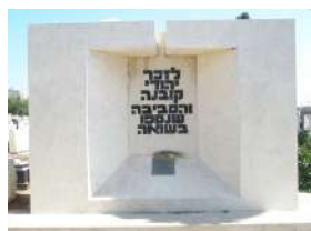
אנדרטה לזכר יהודי קובנה והסיביה שנשפו בשואה, בית הקברות בחולון

קובנה היא העיר השנייה בגודלה בליטא. יהודים התיישבו בה בתחילת המאה ה-18, והקהילה היהודית במקום גדלה בקצב מהיר, עד שמנתה לפני השואה כ-40,000. איש, שהיוו כרבע מאוכלוסיית העיר. החיים היהודים בקובנה שגשגו, ופעלו בה ארגונים יהודיים רבים, בתי כנסת, בתי ספר ועוד. בתחילת מלחמת העולם השנייה נכבשה קובנה בידי הרוסים, ויהודים רבים נעצרו, נרצחו או הוגלו לסיביר. לאחר מכן כבשו הנאצים את העיר והעבירו את היהודים לגטו, שבהמשך הפך למחנה ריכוז, ורק כ-2,000 איש מהתושבים שרדו.