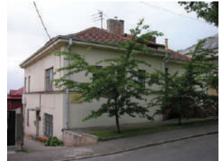
המבנה בו ישבה הקונסוליה היפנית בקובנה

לאחר שכבשו הנאצים את ליטא במהלך מלחמת העולם השנייה, ניסו יהודים רבים להימלט משם. אחת הדרכים להימלט הייתה באמצעות אישורי מעבר פיקטיביים לאי קורסאוו, אותם הנפיק הקונסול ההולנדי בקובנה, יאן זווארטנדיק. על סמך אותם אישורים, חילק הקונסול היפני צ'יאונה סוגיהארה אלפי ויזות לפליטים יהודים, שאיפשרו להם יציאה מרוסיה וליטא ומעבר ביפן. כל ויזה איפשרה ליהודים להימלט עם בני משפחתם, וחלקן נשלחו בחזרה לליטא על ידי היהודים שהגיעו ליפן כדי לסייע גם לאחרים לברוח. אלפי יהודים ניצלו בזכות פעילותם זו של זווארטנדיק וסוגיהארה, שזכו בשל כך לתואר חסידי אומות העולם.