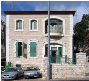
בית חפץ - בית טיפוסי לשכונת רוממה (שכונת רוממה, Wikipedia)

רוממה היא שכונה במערב ירושלים. היא נבנתה בשנת 1921 בתור שכונת פאר עבור יהודים אמידים שרצו לגור הרחק משאון העיר, ונקראה רוממה בשל גובהה, על פי הפסוק "ימין ה' רוממה, ימין ה' עושה חיל" . בתי השכונה תוכננו באופן פרטי, ורחובותיה נקראו על שם עיתונים עבריים. תושבי השכונה סבלו רבות מהתקפות מצד הערבים תושבי הכפרים הסמוכים, ורק לאחר הקמת המדינה היא החלה לפרוח ולגדול. אזור תעשייה מורחב הוקם בצפונה, ובתיה המקוריים נבלעו בתוך הבנייה החדשה. כיום גרים בה כ-30,000 תושבים.