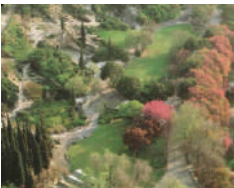
מראה כללי של בית שערים (בן הטבע, Wikipedia)

המושב בית שערים שנוסד ב 1926 נקרא על שם בית שערים הקדומה, מקום מושב הסנהדרין מימי המשנה והתלמוד. רבי יהודה הנשיא שהיה הסמכות הרוחנית המובילה בעולם היהודי במאה ה-2 וה-3, העביר את בית מדרשו ואת הסנהדרין, המוסד הרוחני העליון באותה תקופה, לבית-שערים שנודעה כמרכז תורה גדול. בין השרידים נוספים נמצא בית כנסת בעל עמודים, שפנה לכיוון ירושלים, ובית קברות המורכב ממערכות קברים תת-קרקעיות במערכות מסועפות מהמפוארות שהתגלו בישראל, בעלות כתובות וסמלי תשמישי קדושה יהודיים השופכים אור על חיי היישוב היהודי בארץ ישראל בימי המשנה והתלמוד. חכמי המשנה במקום ורבי יהודה הנשיא עורך המשנה נקברו בבית שערים. שביל הסנהדרין בצפון הארץ עובר אף הוא בבית שערים, וממנו ממשיך אל ציפורי, אושא ומקומות נוספים על השביל.