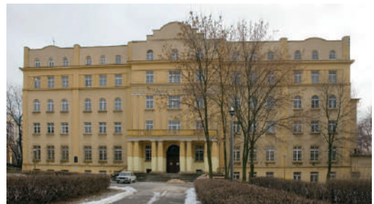
בניין ישיבת חכמי לובלין

עם הגעת הנאצים לעיר לובלין בשנת ת"ש (1940), השמידו הנאצים את ציוד הישיבה, ושרפו בשריפה פומבית גדולה בכיכר השוק בלובלין את כל ספרי הישיבה במשך 20 שעות. בכך בא הקץ על ישיבת חכמי לובלין המפוארת.