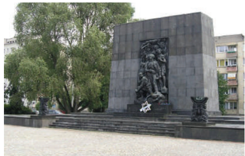
האנדרטה לזכר מרד גטו ורשה, מעשה ידי הפסל נתן רפפורט. האנדרטה מוצבת במקום שבו עמד גטו ורשה

הארגון היהודי הלוחם (אי"ל) הוקם בגטו ורשה בשנת 1942, לאחר שנודע ליהודים שם שהנאצים מתכוונים לרצוח את כולם. מטרתו הייתה להילחם בנאצים, ובראשו עמדו מרדכי אנילביץ' וסגנו יצחק צוקרמן. הארגון לקח את הפיקוד על הגטו והורה ליהודים לא לשתף פעולה עם הוראות השלטון. כאשר התכוונו לגרמנים לחסל את הגטו, פתחו אנשי הארגון במרד גטו ורשה, ותקפו אותם בכלי הנשק שעמדו לרשותם. הם הצליחו לגרום לגרמנים אבידות ולהילחם במשך זמן ממושך. רובם נהרגו לבסוף, וכמה עשרות הצליחו להימלט.