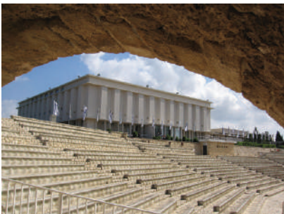
בית לוחמי הגטאות

קיבוץ לוחמי הגטאות יושב בגליל המערבי. הוא נקרא בתחילה "אשר", ולאחר מכן שונה שמו על פי דרישת מקימי היישוב, שהיו קבוצה של ניצולי שואה ולוחמי גטאות ששרדו ועלו לארץ. היישוב הוקם בשנת 1949, ונחנך יום לפני יום השנה השישי למרד גטו ורשה בטקס גדול וחגיגי בו השתתפו גם נציגי ממשלת פולין. בין מקימי היישוב היו יצחק צוקרמן וצביה לובטקין, ממנהיגי המרד. בקיבוץ נבנה בית לוחמי הגטאות, המשמש כמוזיאון לתולדות השואה. כיום גרים ביישוב כ-660 איש.