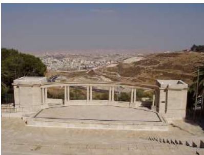
תיאטרון המעלות - אמפיתיאטרון רוטנברג, ברקע נראים מדבר יהודה, אל-זעיים ומעלה אדומים ובאופק ים המלח

הר הצופים הוא אחת משלוש פסגות של רכס הררי הנמצא ממזרח לירושלים, כשלידו הר הזיתים והר המשחית. גובהו הוא 826 מטרים מעל פני הים. הוא נקרא כך משום שאפשר לצפות ממנו ולראות את ירושלים ובית המקדש. על הר הצופים נמצאים האוניברסיטה העברית ובית חולים הדסה. במלחמת העצמאות הוא נותק מירושלים, ולאחריה הפך למובלעת בשטח הירדני, כשחלקו בשליטה ישראלית וחלקו בשליטה ירדנית. במלחמת ששת הימים שחררה ישראל את כל ההר והוא חובר לירושלים.