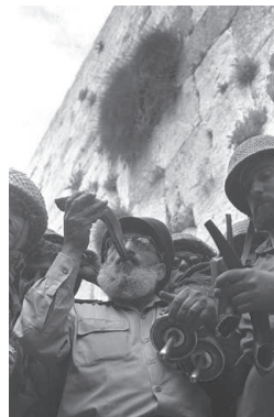
הרב גורן בכותל המערבי

חבורת הפיקוד ופלוגה א' של גדוד 71 להר הבית, ובשעה 10:00 הכריז מוטה גור בקשר "הר הבית בידינו!". הכרזה זו עוררה התרגשות רבה בכל עם ישראל, והפכה לאחד הסמלים הידועים של הניצחון במלחמת ששת הימים. כמה דקות לאחר מכן הגיע למקום הרב שלמה גורן, הרב הצבאי הראשי, ותקע בשופר.