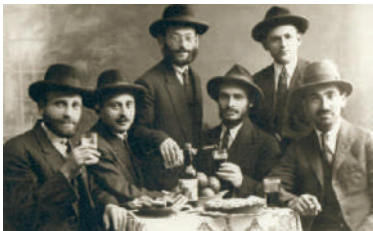
חלק ממיסדי כפר אתא בסוף שנות ה-20

קריית אתא היא עיר באזור חיפה. היא הוקמה בשנת תרפ"ה (1925) בתור מושבה שנקראה בתחילה כפר עטא. במאורעות תרפ"ט היא ננטשה, אולם תושביה חזרו אליה מאוחר יותר. בעקבות הקמת בית חרושת לאריגים במקום שנקרא "אתא" ("אריגים תוצרת ארצנו"), שונה שם היישוב לכפר אתא. בשנות החמישים הוקמו ליד היישוב שלוש מעברות, שחלקן התמזגו איתו בהמשך. בשנת 1965 התאחד כפר אתא עם המועצה המקומית קריית בנימין, ונקראה קריית אתא. ארבע שנים מאוחר יותר הוכרזה קריית אתא כעיר. כיום היא העיר הגדולה ביותר מבין הקריות, וגרים בה יותר מ-57 אלף תושבים.