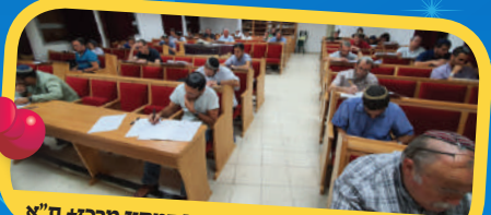
חלק ממתמודדי החידון המחוזי במחוז מרכז+ ת"א