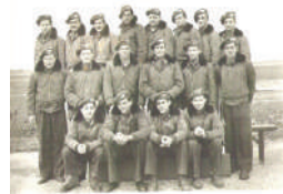
חניכי קורס טיס מס' 2, קורס הטיס הראשון שהתנהל כולו בישראל

בדצמבר 1948 עבר מטה חיל האוויר לקריה בתל אביב.