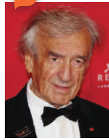
אלי ויזל

אלי ויזל היה סופר ועיתונאי, ניצול שואה, שהקדיש את חייו להנצחת זכר השואה וסיוע ליהודים במצוקה בכל העולם. מלבד זאת היה פעיל זכויות אדם ופעל בנוגע לסכסוכים אלימים רבים בעולם, ביניהם האפרטהייד בדרום אפריקה, מאבק הכורדים, הטיהור האתני ביוגוסלביה ועוד. הוא עמד בראש הוועדה הנשיאותית לזכר השואה בארה"ב, ועל פעילותו בה זכה בשנת 1986 בפרס נובל לשלום. ועדת הפרס כתבה עליו כי הוא "שליח לאנושות, שבמאבקו להשלים עם חוויתו האישית של השפלה מוחלטת בשילוב עם עבודתו המעשית למען השלום, העביר מסר רב עוצמה של שלום, כפרה וכבוד אנושי". בנוסף לכך זכה בעיטורים האזרחיים הגבוהים ביותר בארה"ב, מדליית החירות הנשיאותית ומדליית הזהב של הקונגרס.