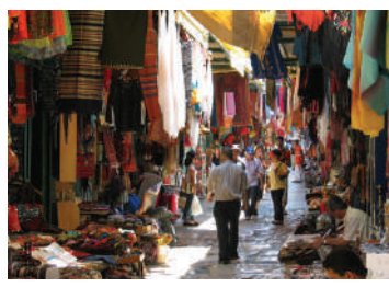
שוק העיר העתיקה בירושלים

שוק עושי הכותנה נמצא ברובע המוסלמי שבעיר העתיקה בירושלים. הוא הוקם במאה ה-14 בידי האמיר תנכ"ז על הריסות שוק צלבני, ולא השתנה הרבה מאז. זהו אזור מקורה באורך כמאה מטרים, שמשני צידי שערם מפוארים. יש בו שתי קומות, קומת הקרקע מכילה 50 חנויות והקומה השנייה דירות מגורים. גרם מדרגות שנמצא בשוק מוביל לשער מוכרי הכותנה בהר הבית. שמו של השוק ניתן לו בשל היותה של ירושלים מרכז לתעשיית הכותנה שגדלה בנחל איילון, אך יהודי ירושלים נהגו לכנות אותו "החנויות".