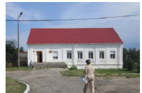
מבנה ישיבת וולוז'ין כיום

ישיבת וולוז'ין נוסדה בידי ר' חיים מוולוז'ין, תלמידו הגדול של הגר"א, בשנת תקס"ב (1802). שמה הרשמי היה "ישיבת עץ חיים", והיא זכתה לכינוי אם הישיבות. בישיבה למדו תורה ברמה גבוהה והתקיימו בה משמרות לימוד סביב השעון 24 שעות ביממה. הרבה תלמידי חכמים בולטים למדו בישיבת וולוז'ין, ביניהם ר' שמואל סלנט, ר' שמעון שקאפ, ר' חיים מברסקי, הראי"ה קוק ועוד רבים. בתקופה בה כיהן הנצי"ב כראש הישיבה, פעלו בה אגודות סתרים של חובת ציון. הישיבה נסגרה בשנת תרנ"ב (1892) בעקבות לחצי השלטונות לצמצם בלימוד התורה ולהכניס במקומו לימודי חול.